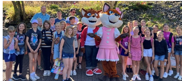
Messdienerausflug zum Fort Fun im September