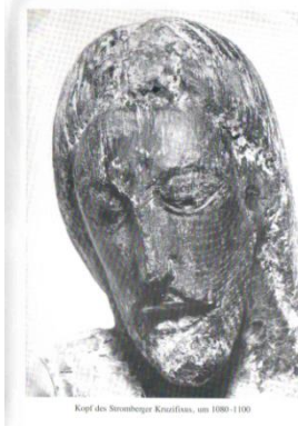
Kopf des Stromberger Kreuzes, um 1080-1100

Seit mehr als 800 Jahren besuchen die christlichen Pilger das Heilige Kreuz von Stromberg. Es gehört zu den ältesten Christusbildungen in Westfalen. Experten datieren den Eichenholzkern auf die Entstehungszeit zwischen 1080 und 1100.