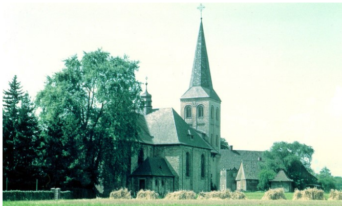
Blick auf die St.-Vitus-Kirche in den 1950er Jahren

Ein kleiner Einblick in die Letter Heimatgeschichte